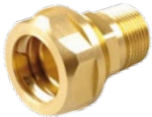
Modell SKS 2 01