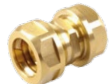
Modell SKS 2 05

NEU: Jetzt auch Reduzier-Einsätze erhältlich