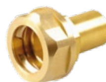
Modell SKS 2 550