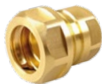
Modell SKS 2 110