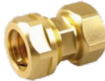
Modell SKS 2 500